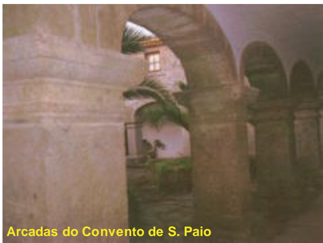
Arcadas do Convento de S. Paio

Convento de S. Paio está em território de Loivo e não em espaço pertencente a Candemil