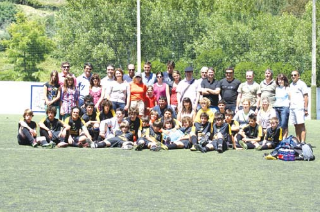
Foto relativa ao jogo amigável entre o C.D. CERVEIRA e o A.C. MALVEIRA, em iniciados, no dia 11 de junho de 2011, no campo desta última simpática agremiação desportiva, que os cerveirenses venceram por 3-1.

Ao que se verifica, este acontecimento desportivo está a despertar um certo interesse nos participantes.