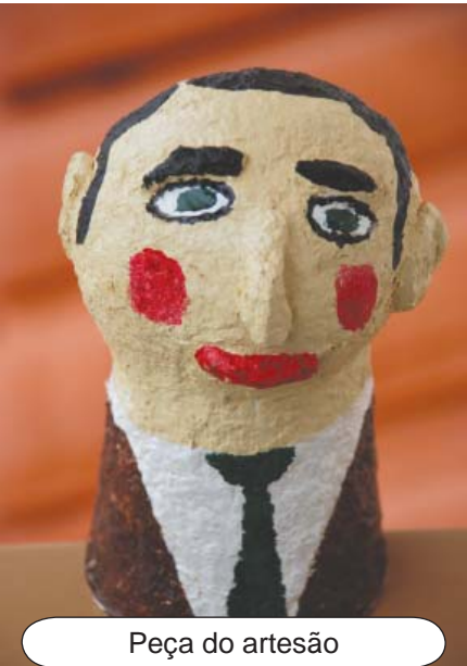
Peça do artesão