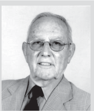
Escreve: Gaspar Lopes Viana

Cumprindo uma saudável tradição e com imaginação e o colorido a predominar nas vestes, decorreu uma vez mais, em Vila Nova de Cerveira, com grande euforia, o animado cortejo de carnaval, que teve a participação das escolas deste concelho, professores e muitos alunos fantasiados que percorreram, com alegria contagiante, as principais ruas e largos da vila, proporcionando boa disposição, ao mesmo tempo que se divertiam com serpentinas ao longo do percurso, dando assim mais brilhantismo ao desfile, tanto do agrado da população do Alto Minho.