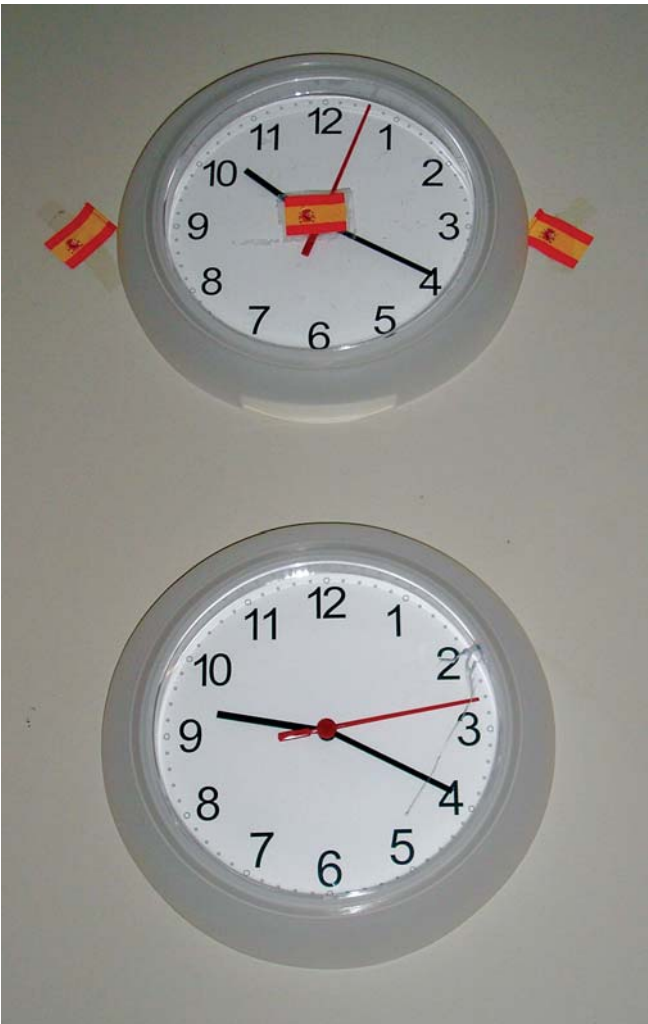
do por quem teve a ideia e a pôs em prática.

E como dois simples relógios marcam as diferenças do tempo de dois povos ibéricos, tudo bem aproveita-