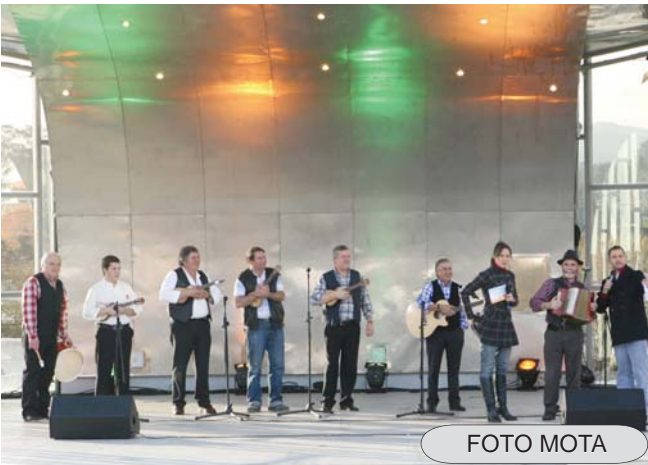
ras cerveirenses que estiveram disponíveis para colaborar com a RTP.

Portanto, um espaço preenchido com temas e figu-