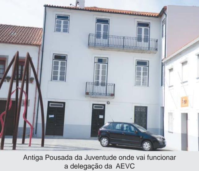
Antiga Pousada da Juventude onde vai funcionar a delegação da AEVC

Ainda de referir que no Auditório Municipal teve lugar, englobado nas comemorações das bodas de prata do Coral Polifónico, a atuação do grupo Tramadix, de Braga, cuja principal característica é a sua dedicação à música instrumental.