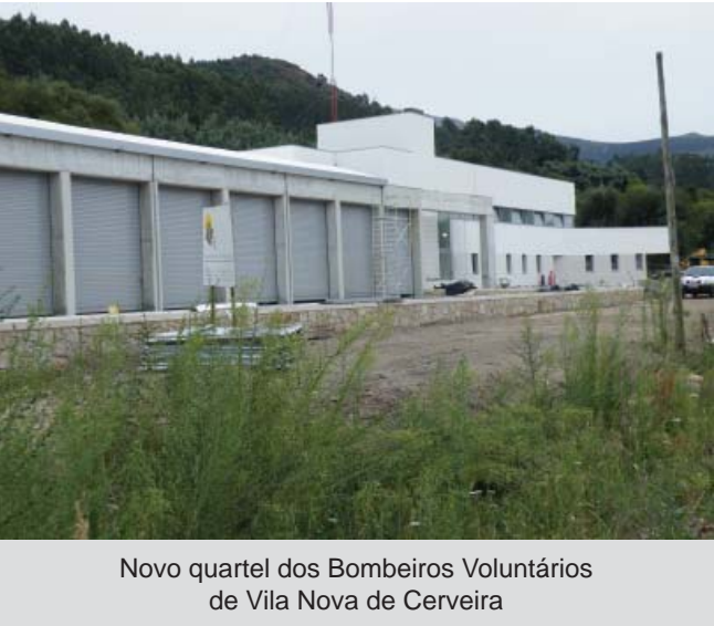
Novo quartel dos Bombeiros Voluntários de Vila Nova de Cerveira