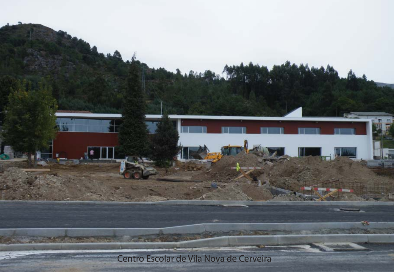
Centro Escolar de Vila Nova de Cerveira

Não havendo contratempos, a estrutura letiva será inaugurada no dia 25, sexta-feira, enquanto o novo quartel dos bombeiros entra em funcionamento do dia 1 de Outubro, feriado municipal. Ambos os equipamentos, fundamentais em questões educativas e de segurança de bens e pessoas, representaram um investimento de 3,3 milhões de euros.