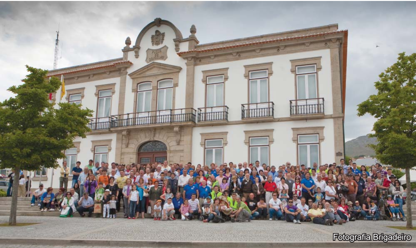
O elevado número de pessoas que no dia 10 de maio participou, em Vila Nova de Cerveira, nos atos integrantes da 1.ª Concentração Ibérica de Clássicos, certame que reuniu mais de uma centena de veículos.

Das vezes que assisti aos jogos do C.D. Cerveira deu para perceber que o Clube tem um bom plantel acrescido de ser quase na totalidade de jogadores oriundos do concelho ou concelhos limítrofes. Acresce ainda que no conjunto cerveirense os jogadores treparam todos os escalões de formação, participaram nos mais variados campeonatos o que lhe deu um grande traquejo. Outros ainda passaram pelas camadas jovens de clubes de referência do futebol Português o que é sempre uma mais-valia pelo que aprenderam e para o próprio clube pela utilidade e experiência que transmitem dentro do grupo.