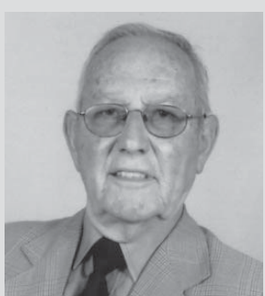
Escreve: Gaspar Lopes Viana

Uma sapataria, localizada nesta vila, foi ultimamente assaltada por duas pessoas do sexo feminino, que tudo indica serem romenas, ambas bem vestidas e bem-falantes e com idades aparentemente entre os 40-50 anos. Seriam 19 horas, altura em que o estabelecimento se preparava para encerrar, quando a empregada foi surpreendida com a entrada repentina dos dois falsos “clientes”, manifestando o desejo de comprar calçado. Enquanto um procurava iludir a empregada, junto de um mostruário de calçado, o outro dirigiu-se ao interior do balcão, sem dar nas vistas, e conseguiu levar uma bolsa de senhora que continha dinheiro, bilhete de identidade, carta de condução e outros documentos, e ainda diversos objetos pessoais.